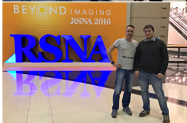
Nordamerikanischer Röntgenkongress RSNA 2016, Chicago, McCormick Place Convention Center