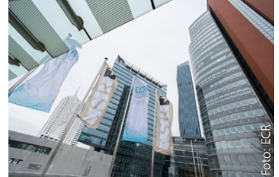
Europäischer Röntgenkongress ECR 2016, Wien (Vienna International Center)