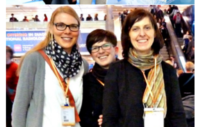
Europäischer Röntgenkongress ECR 2016, Wien (Vienna International Center)