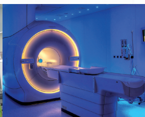
Genaue Diagnostik mit technischer Ausstattung auf höchstem Niveau