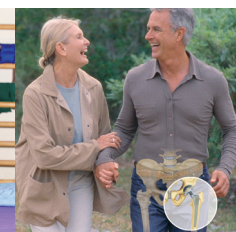
Wiedergewonnene Lebensqualität nach der OP

Die Verbesserung der Behandlungsqualität und der langfristigen Behandlungsergebnisse ist das Ziel der Zentrenbildung in der Gelenkersatzchirurgie.