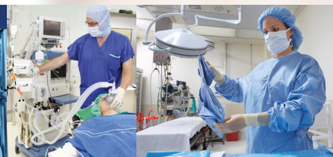
Praktische Ausbildung im OP, Zentraler Sterilgutversorgung (ZSVA), Endoskopie, Zentraler Notaufnahme und Akutpflege.